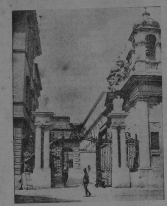
La fotografía muestra la entrada del nuevo Estado Vaticano, situado en Roma, pudiendo verse de un lado de la puerta a un guardia suizo y del otro a un centinela fascista.